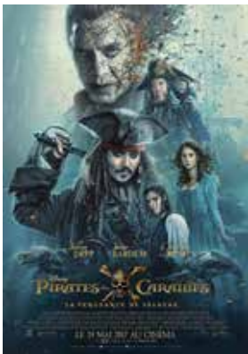
1. Para 12 años: Piratas del Caribe. La venganza de Salazar

La venganza es uno de los temas más recurrentes, tanto en la realidad como en la ficción. Presentamos una serie de sugerencias cinematográficas que la tratan. Si decidís ver alguna de estas películas en clase o en familia, comentad por qué resulta un tema tan atractivo narrativamente. Tened en cuenta la clasificación por edades.