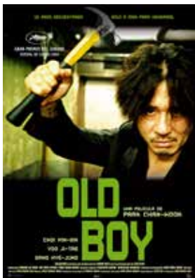
2. Para mayores de 18 años: Old boy