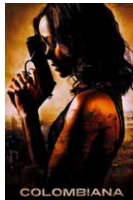
4. Para 16 años: Colombiana

¿Se te ocurre, después de haber visto alguna de estas películas, por qué el tema de la venganza es tan significativo? ¿Crees que la venganza es una forma de conseguir justicia? ¿Es una respuesta moralmente correcta o incorrecta ante las injusticias que vivimos? ¿Por qué?