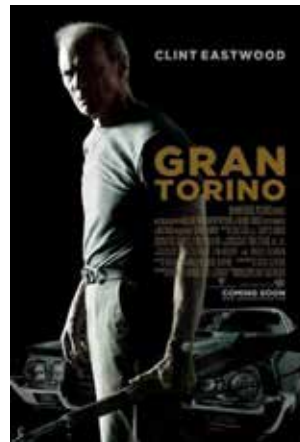
3. Para 12 años: Gran Torino